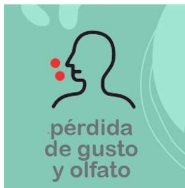
Pérdida de gusto y olfato