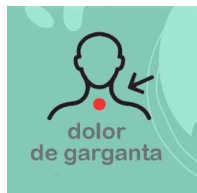
Dolor de garganta